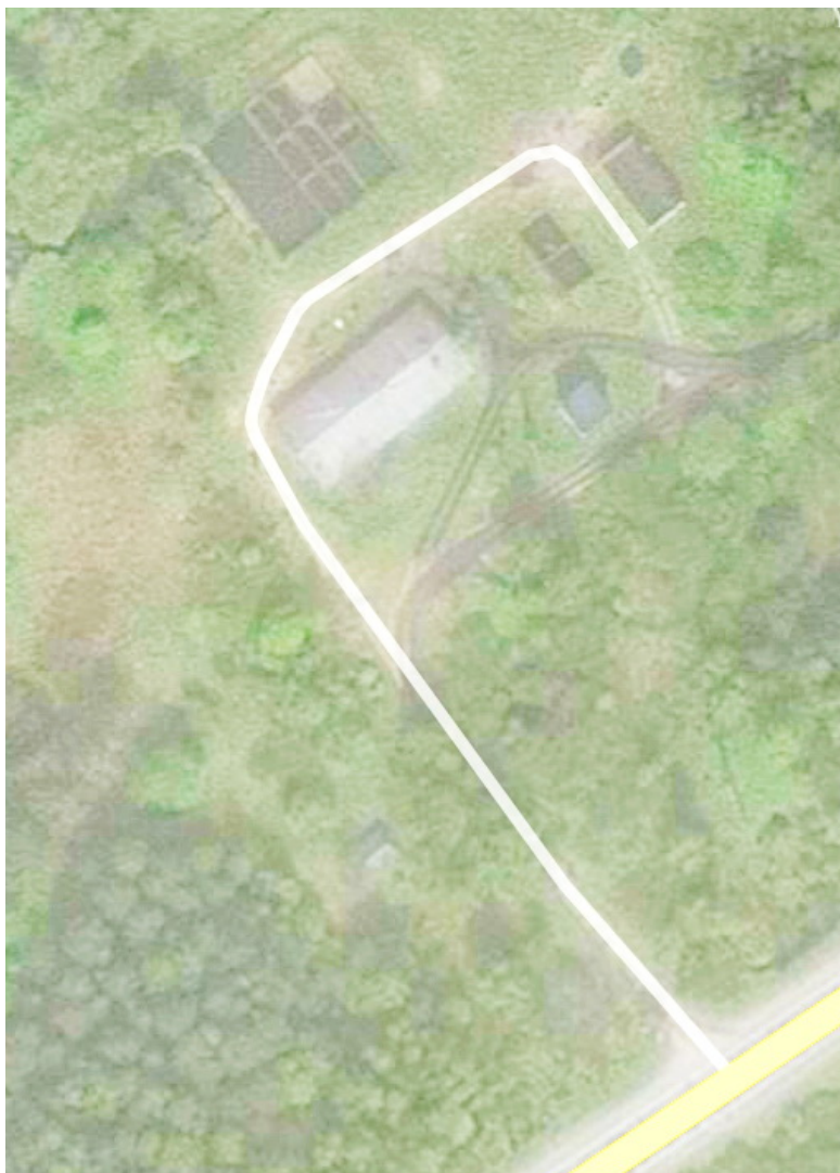
Рисунок 3.1.1 – План ОСК

Очистные сооружения канализации (ОСК) находятся по ул.Дорожной за автомагистралью.