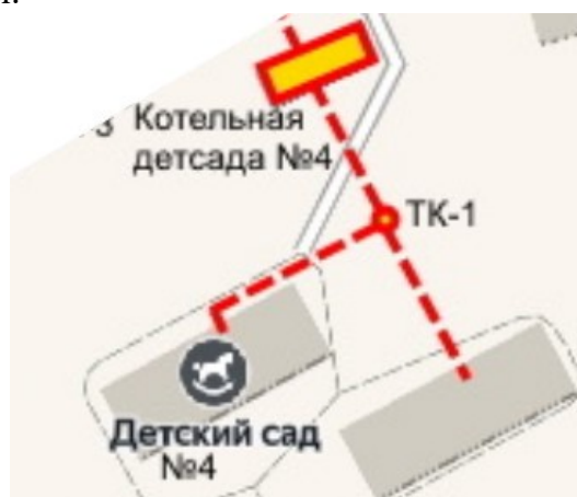
Рисунок 2.12.1 – Схема сетей ГВС детского сада №4

Потребителем горячей воды является детский сад № 4 от котельной ООО «ТЕПЛОСБЫТ», расположенной на территории этого детсада. Годовое потребление горячей воды составляет около 80 м 3 . Подача горячей воды с котельной осуществляется по 2-х трубной рециркуляционной линии. Схема сетей ГВС приведена на рисунке 2.12.1. Другим потребителям подача горячей воды на период действия настоящей схемы водоснабжения не планируется.