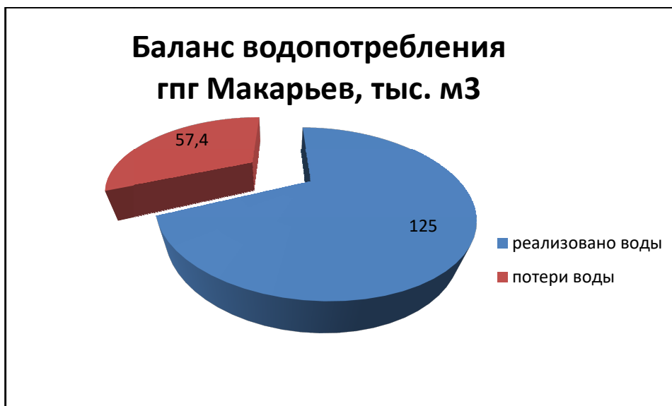
Рисунок 2.11.1 - Общий баланс водопотребления ГП г. Макарьев в 2023 году