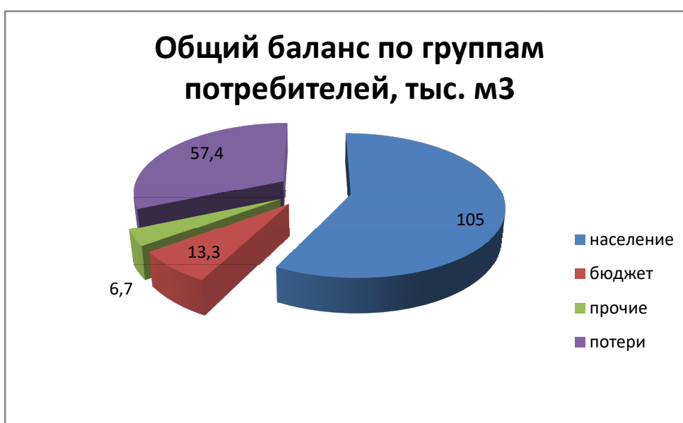
Рисунок 2.11.5.1 - Структурный баланс водопотребления по группам потребителей